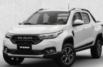
TRADESMAN REGULAR CAB • TRADESMAN CREW CAB BIGHORN • BIGHORN CVT • LARAMIE CVT