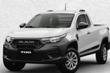
TRADESMAN REGULAR CAB