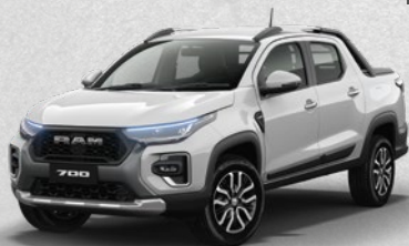
LARAMIE CVT TURBO